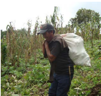
CUC : travail dans les champs.