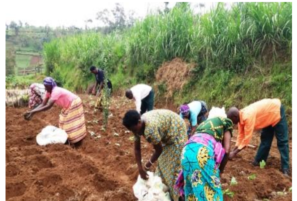
Adenya : travail dans les champs.

Une catastrophe naturelle se définit comme « un événement d'origine naturelle, subi et brutal, qui provoque des bouleversements importants pouvant engendrer de grands dégâts matériels et humains ». Mais si l'homme n'a pas de prise sur l'événement et que la nature agit aveuglément, les mesures de vulnérabilité des populations face aux risques montrent de très fortes inégalités entre les pays du Nord et du Sud.