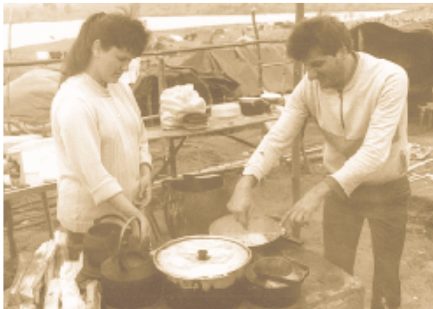
La souveraineté alimentaire est l'affaire de la société dans son ensemble. Au Nord comme au Sud...

«La base principale pour forger un peuple libre et souverain est qu'il possède les conditions pour produire sa propre nourriture. Si un pays devient dépendant d'un autre pour nourrir son peuple, il devient une nation dépendante politiquement, économiquement et idéologiquement».